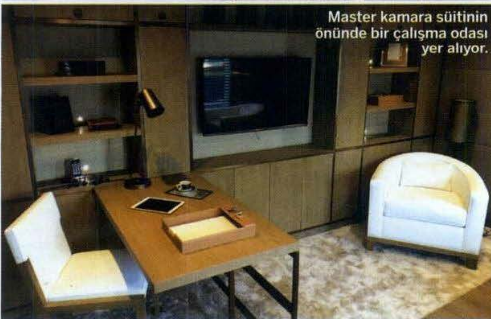
Master kamara süitinin önünde bir çalışma odası yer alıyor.

merdivenleri, günlük tuvalet ve ilerisinde çalışma ofisiyle master kamara süiti yer alıyor. 48 m 2 'lik büyüklüğüyle dikkat çeken süit iki bölümden oluşuyor. Dinlenme bölümünün merkezinde çift kişilik yatak, karşısında büyük bir LED TV, sancak tarafıya dinlenme koltuğuna yer verilmiş. Giyinme odasında dolaplar olmasına rağmen burada ayrıca karşılıklı iki tam boy gardırop var. Dinlenme bölümünün ilerisinde sancak ve iskele taraftan girişi olan giyinme ve banyo bölümü bulunuyor. Banyoda kullanılan mermer lavabo ve duvardaki ayna detayı buraya hoş bir hava katmış.