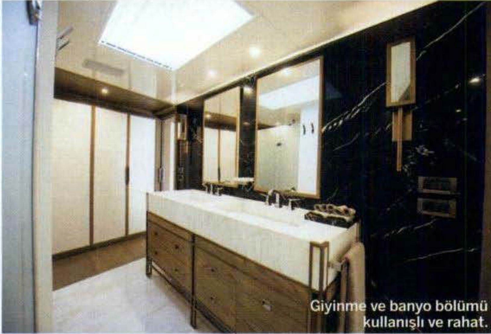
Giyinme ve banyo bölümü kullanışlı ve rahat.

Master kamara süiti, kullanılan çok sayıda gövde camıyla aydınlık ve ferah.