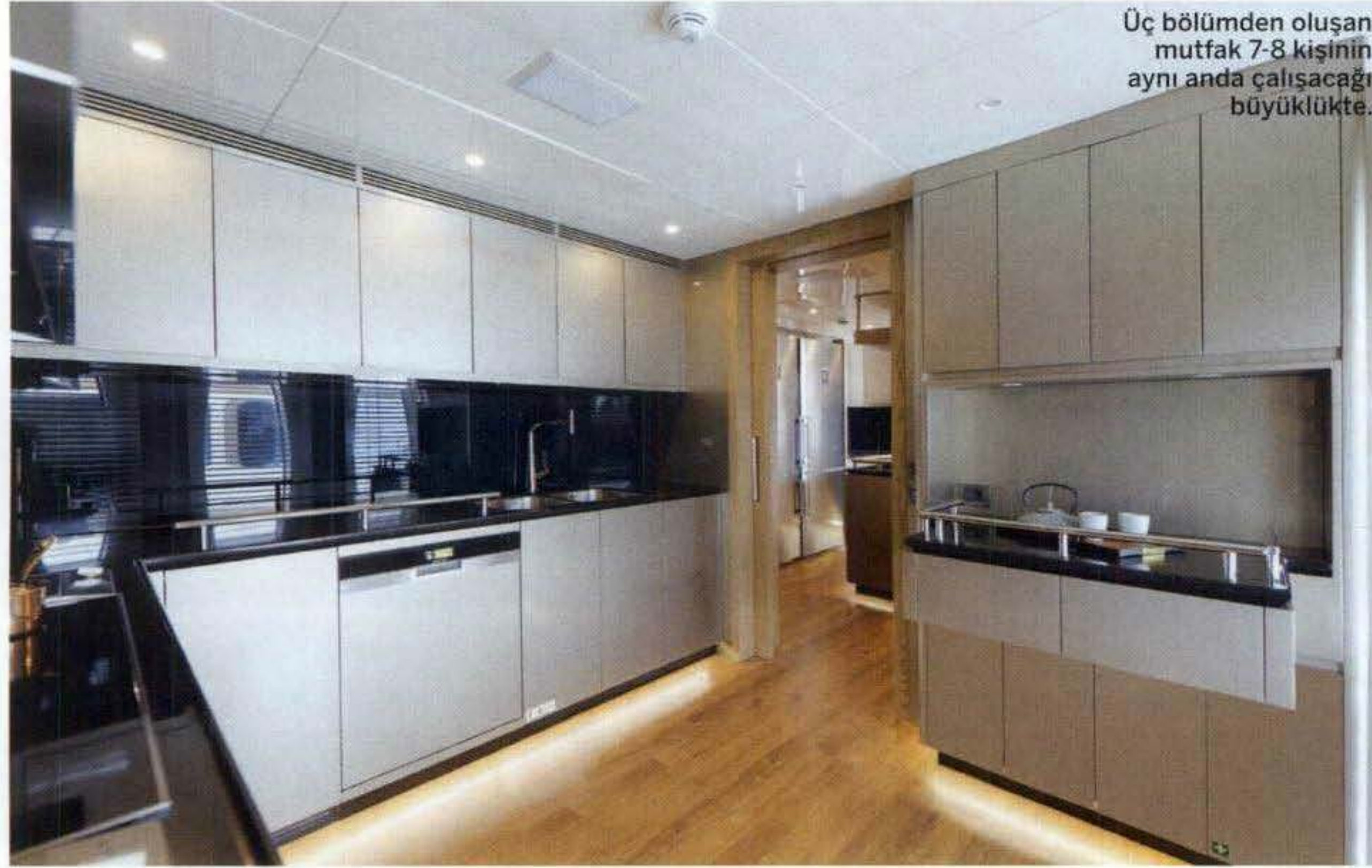
Üç bölümden oluşan mutfak 7-8 kişinin aynı anda çalışacağı büyüklükte.