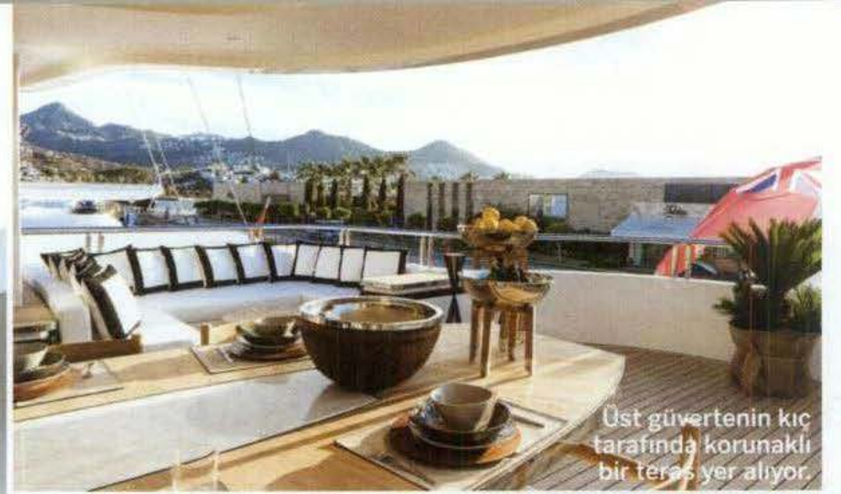
Üst güvertenin kıç tarafında korunaklı bir teras yer alıyor.